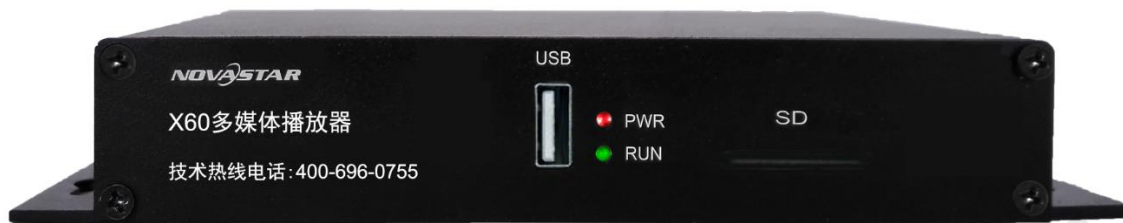
图 1 前面板