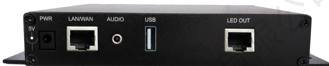
图 2 后面板

(注：部分产品后面板会印有“X60 多媒体播放器”字样，功能无任何差别。请以实物为准。)